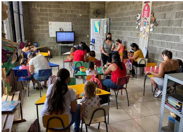
Biblioteca Pública de San Pedro de Poas

Soy bebé y me gusta leer apoya el desarrollo sociocultural de niños y niñas entre 0 a 5 años por medio del estímulo del hábito y el gusto por la lectura realizando actividades proactivas utilizando recursos lúdicos, tecnológicos, documentales y audiovisuales.