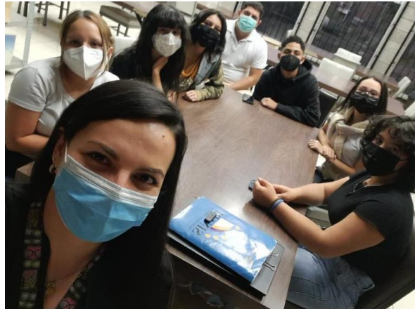
Biblioteca Pública de Sarchí

Bibliotecas de puertas abiertas promueve la cultura de la interacción social e interpersonal de forma equitativa e igualitaria al estimular el hábito y placer por la lectura en comunidades que no cuentan con biblioteca por medio de actividades de extensión bibliotecaria y cultural proactivas utilizando recursos lúdicos, tecnológicos, documentales y audiovisuales.