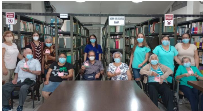
Biblioteca Pública de Naranjo

Huellas de oro: promueve el placer por la lectura y se ofrecen talleres, conversatorios, club de lectura, foros de discusión, alfabetización informacional, para la persona adulta mayor, realizando otras actividades de extensión bibliotecaria y cultural en las bibliotecas públicas del SINABI.