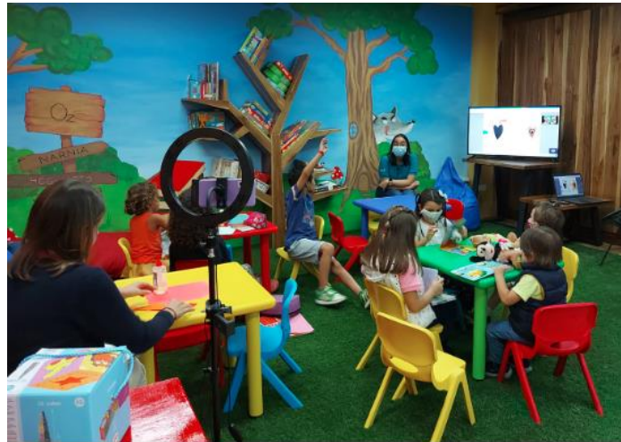
Actividad bimodal de Soy bebé y me gusta leer en la Biblioteca Pública de Montes de Oca

Durante este semestre se han retomado las actividades presenciales, sin embargo, se continúan realizando de forma virtual, así como bimodales. La comunicación y promoción de las diversas actividades se realiza mediante las páginas de Facebook de las bibliotecas, grupos de WhatsApp o comunicación directa con las personas. Las personas usuarias han mostrado gran aceptación por la apertura cada vez más de la presencialidad, demostrando que las bibliotecas son espacios importantes en sus comunidades.