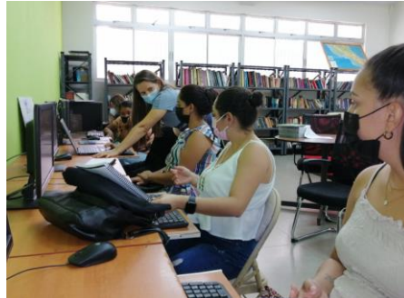
Biblioteca Pública de Santa Cruz

Sin embargo, es importante mencionar que muchas más personas se conectaron a esta red y se vieron beneficiadas, al acceder desde sus equipos tecnológicos personales.