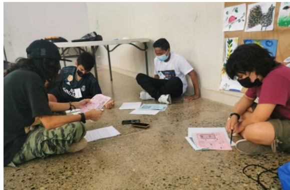
Biblioteca Pública de Garabito

Guanacaste, Santa Cruz, Santa Cruz 147 personas: 36 hombres, 101 mujeres y 10 sin definir