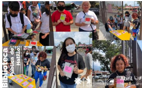
Biblioteca Pública de Hatillo

Bibliotecas de puertas abiertas promueve la cultura de la interacción social e interpersonal de forma equitativa e igualitaria al estimular el hábito y placer por la lectura en comunidades que no cuentan con biblioteca por medio de actividades de extensión bibliotecaria y cultural proactivas utilizando recursos lúdicos, tecnológicos, documentales y audiovisuales.