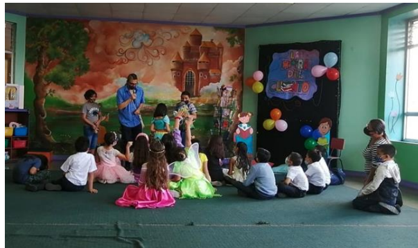
Biblioteca Pública de Cartago

Arcoíris de lectura para niños y niñas de 6 años a 12 años permite democratizar el acceso a la información y el conocimiento por medio de actividades que estimulan el hábito y placer por la lectura dirigida a niños y niñas desde la biblioteca pública utilizando recursos lúdicos, tecnológicos, documentales y audiovisuales.