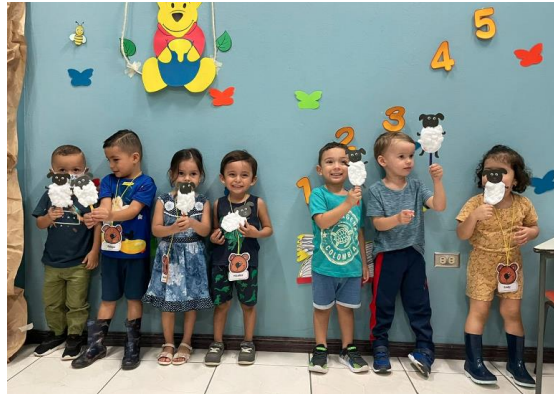
Biblioteca Pública de Liberia

En el programa Soy bebé y me gusta leer, dirigido a niñez entre 0 y 5 años se trabaja principalmente el fomento del gusto por la lectura desde edades tempranas. Se desarrollan talleres de estimulación a la lectura que generalmente constan de una sesión por semana. La persona adulta responsable se compromete a participar activamente de las actividades con los niños y niñas, y a su vez ser copartícipe del proceso de adquisición de este hábito.