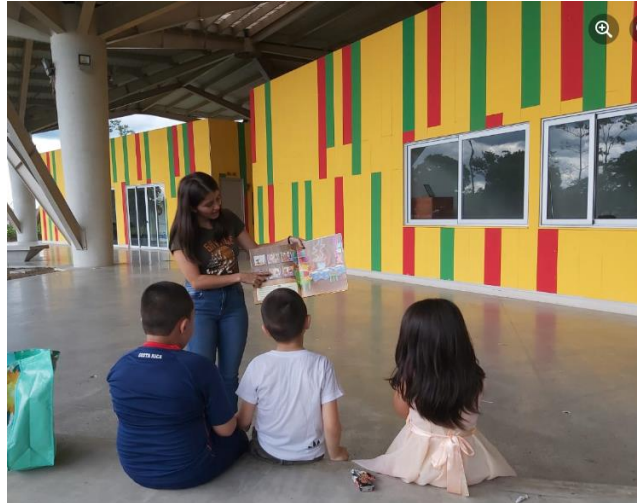
Biblioteca Pública de Pococí

Las redes sociales y el Portal del SINABI han sido elementos muy importantes en la atención de las personas usuarias de las bibliotecas. En el I Semestre de 2022 el portal recibió 75.398 visitas desde 93 países, 533.322 páginas fueron visitadas y se continúa ofreciendo información de su contenido mediante las redes sociales. Además, se incluyó nuevo contenido: 1 libro, 17 títulos nuevos de y 947 ediciones de periódicos, 3 título de revista y 145 números, 7 audios, 1 Exposición y 1 Bibliografía Nacional.