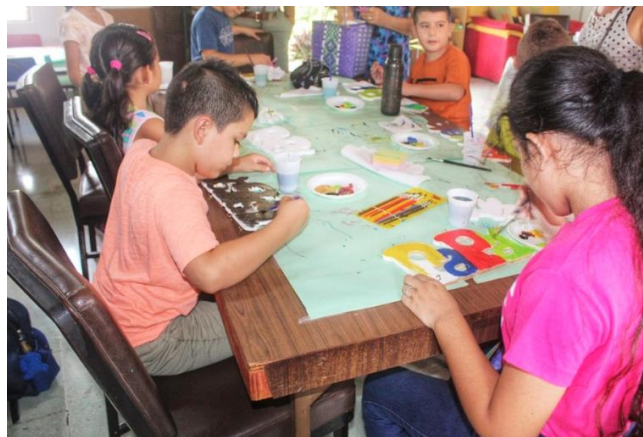
Biblioteca Pública de San Mateo

Las actividades desarrolladas en el programa Arcoíris de lectura con niñez entre 6 y 12 años se enfocan a promocionar la lectura de una forma lúdica y agradable por medio de diferentes actividades. De esta forma los niños y niñas se ven inmersos en el mundo de la lectura y la biblioteca, para de disfrutar del tiempo libre de una forma productiva.